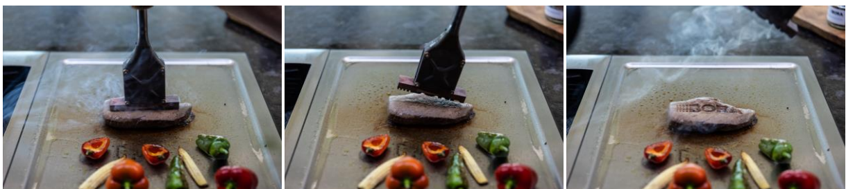
Wer die BORA Experience einmal erlebt hat, ist überzeugt vom effektiven Dunstabzug nach unten. Das und mehr bei der BORA Hausmesse in Herford.