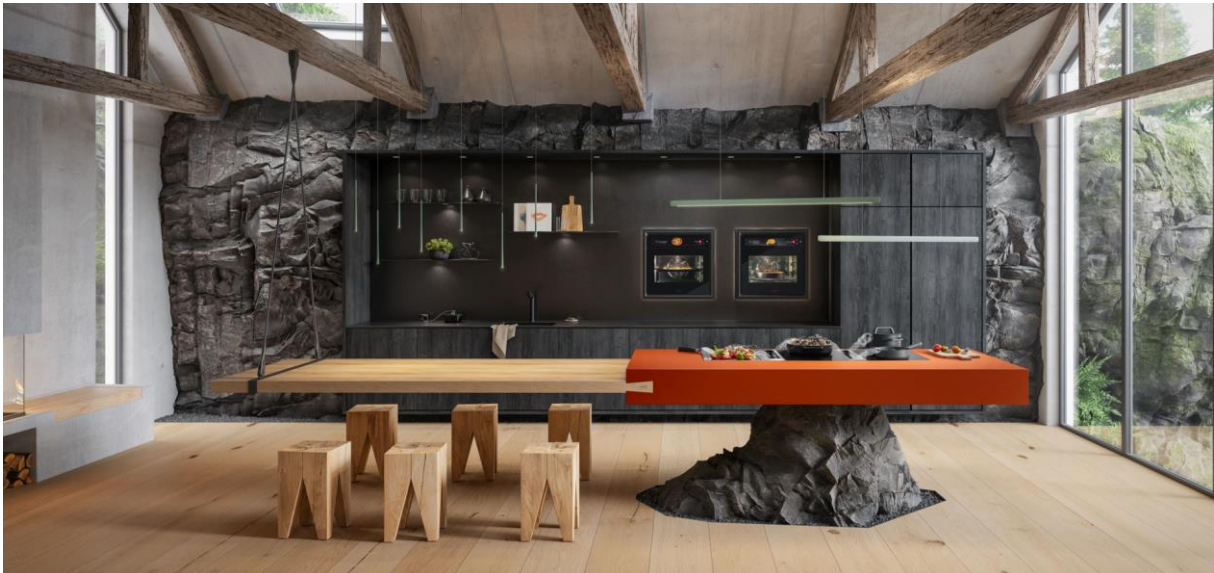
Presentada por primera vez durante la feria Küchenmeile en otoño de 2024, la Cocina de Autor representa el sistema completo de productos BORA disponibles para los clientes finales de los minoristas de cocinas y figura en la comunicación visual de la marca y en los materiales para minoristas para 2025